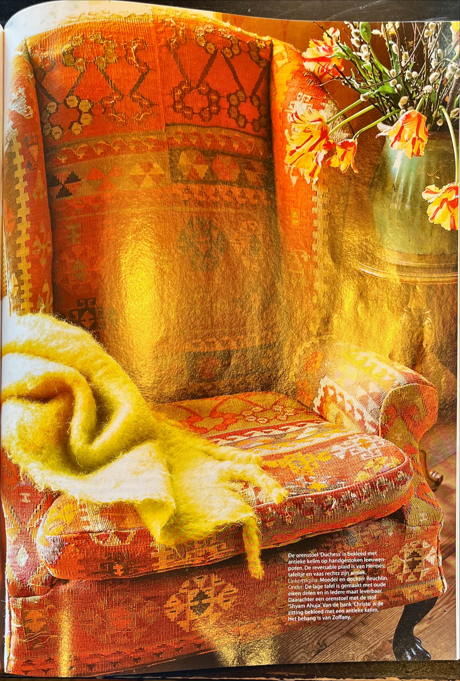
De orenstoel 'Duchess' is bekleed met antieke kelim op handgestoken leeuwenpoten. De reversable plaid is van Hermès, tafeltje en vaas rechts zijn antiek. Linkerpagina: Moeder en dochter Reuchlin. Onder: De lage tafel is gemaakt met oude elken delen en in iedere maat leverbaar. Daarachter een orenstoel met de stof 'Shyam Ahuja'. Van de bank 'Christo' is de zitting bekleed met een antieke kelim. Het behang is van Zoffany.